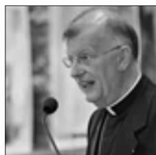
L'arcivescovo Roland Minnerath

sfera dello spirito e della coscienza di fronte alle potenze di questo mondo».