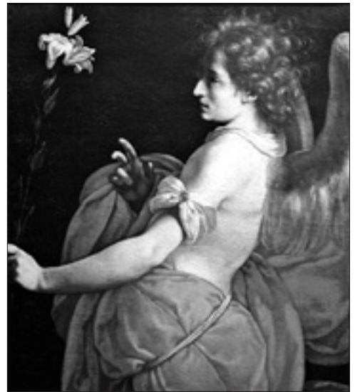
«Angelo annunciante» (Torino, Accademia Albertina)

Gli anni Quaranta del Seicento sono dunque l'occasione nella quale Carlo Ceresa raggiunge una reale