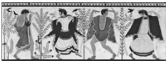
Decorazione della Tomba del Triclinio di Tarquinia (470 prima dell'era cristiana, copia di Carlo Ruspi del 1833, Musei Vaticani)

Proprio dal Museo Gregoriano Etrusco, uno dei settori delle raccolte pontificie, fondato da Papa Gregorio XVI nel 1837, sono partite alla volta di Asti circa centoquaranta opere. A esse si sommano tante altre testimonianze, generosamente messe a disposizione dalle istituzioni museali italiane (undici enti prestatori) per un totale di trecentoquarantatré oggetti che illustreranno la civiltà etrusca attraverso finestre tematiche selettive.