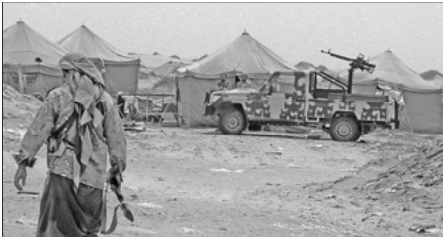
Un militare yemenita in un avamposto nella provincia di Abyan

KINSHASA, 9. Circa tremila persone sono fuggite dalle loro abitazioni nella provincia Orientale della Repubblica Democratica del Congo, a causa di nuove violenze dell'Lra, il gruppo, originariamente nordgandese, responsabile da venticinque anni di sistematiche atrocità in diverse aree dei Grandi Laghi. Secondo l'alto commissario delle Nazioni Unite per i rifugiati (Unhcr), dall'inizio dell'anno l'Lra ha sferrato una ventina di attacchi in territorio congolese, dove sono nel 2005 le sue basi dopo aver perso quelle tradizionali in Sud Sudan. Secondo le informazioni dell'Unhcr gli sfollati si trovano in gran parte senza acqua potabile e senza servizi igienici, nonostante interventi già messi in atto sia dalle agenzie dell'Onu sia da organizzazioni non governative.