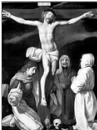
«Cristo in croce con santa Maria Maddalena e due discepoli» (Mapello, chiesa di San Michele)

Grazia plebea e ancora intatta, che mette davanti ai nostri occhi, come se non fosse passato neanche un giorno, «il suo calore lento e profondo, la sua lenta, opaca, ma come lenzuola bellezza».