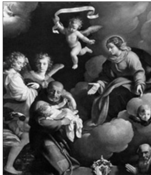
«Visione di san Felice da Cantalice con il donatore» (Nese, chiesa di San Giorgio)

Il Pontificio Consiglio della Cultura promuove un concorso internazionale di composizione