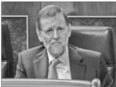
Mariano Rajoy prima del voto in parlamento

MADRID, 9. Con 197 voti favorevoli e 142 contrari il Parlamento spagnolo ha approvato ieri la riforma del lavoro. Il provvedimento ha l'obiettivo di rendere meno oneroso per le imprese licenziare e di ridurre il tasso di disoccupazione arrivato al 23 per cento, ha spiegato il presidente del Governo, Mariano Rajoy.