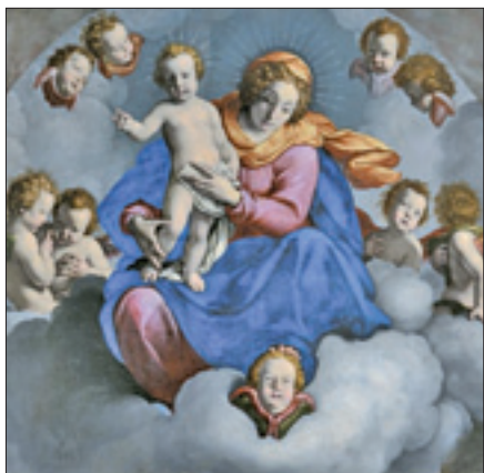
«Madonna in gloria e santi» (1643, particolare)