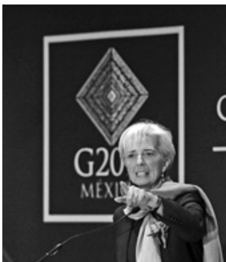
Il direttore generale del Fondo monetario internazionale

Per quanto riguarda l'Europa, Lagarde ha affermato che i mercati non dovrebbero puntare contro l'Italia. Insomma, puntando sul ribasso dei titoli italiani si rischia di perdere. Le misure adottate dal Governo di Mario Monti potrebbero essere «la luce in fondo al tunnel europeo» ha detto il direttore generale dell'Fmi, secondo il «Wall Street Journal». Sempre sul piano europeo, il Fondo giudica che la Bce abbia spazio per l'uso di strumenti non convenzionali in grado di stabilizzare il mercato. Lo ha detto ieri il capo delle pubbliche relazioni del Fondo, Gerry Rice, rispondendo alle domande dei giornalisti sulla decisione della Bce di lasciare invariato all'un per cento il tasso di riferimento principale di eurozona. «Date le persistenti tensioni sul mercato la Banca centrale europea non dovrebbe esitare a utilizzare strumenti non convenzionali come ha peraltro già fatto» ha precisato Rice. Una discussione più ampia su queste misure dovrebbe avere luogo nei prossimi consigli Ue.