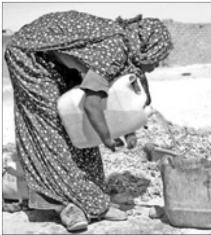
Una donna in un campo profughi

BAMAKO, 9. Aumenta il numero dei profughi causati dal conflitto nel nord del Mali, dove dal 17 gennaio scorso i ribelli, in maggioranza di etnia tuareg, del Movimento di liberazione nazionale dell'Azawad (Mlna) hanno lanciato un'offensiva contro l'esercito governativo. Secondo l'Ufficio dell'Onu per il coordinamento degli affari umanitari (Ocha) i combattimenti hanno messo in fuga oltre 172.000 persone, tra circa 82 sfollati interni e i rifugiati in Mauritania (34.739), Niger (28.858), Burkina Faso (21.653) e Algeria (circa 5.000).