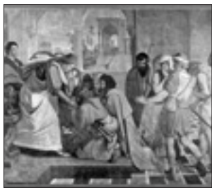
Peter von Cornelius, «Giuseppe si fa riconoscere dai fratelli» (1817)

Ritengo del resto che per quanto riguarda il ritorno di un vecchio antisemitismo o l'insorgere di un antisemitismo nuovo, quest'azione comune della Chiesa cattolica e delle comunità ebraiche sia il miglior modo per prevenire lo sviluppo, poiché mette in evidenza ciò che ci unisce, fratello maggiore e secondogenito.