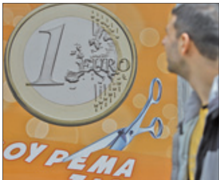
Un barbiere al centro di Atene offre tagli di capelli a 1 euro

ATENE, 9. «Lo swap sul debito ha avuto un grado di successo estremamente alto». Le parole di Evangelos Venizelos, ministro delle Finanze greco, confermano quanto molti già sapevano: la crisi del debito europeo è a una svolta positiva. Con la riuscita dello swap obbligazionario Atene taglia sensibilmente la massa dei crediti in mano ai privati, un passo in avanti decisivo verso il raggiungimento dell'obiettivo di un debito al 120,5 per cento del pil nel 2020. «Continueremo a implementare le misure che servono per raggiungere l'aggiustamento di bilancio e le riforme strutturali» ha dichiarato Venizelos. Ammontano all'85,8 per cento le adesioni dei creditori privati allo swap sul debito greco. Lo rivela il Governo di Atene, il quale attiverà le Cac (clausole di azione collettiva) che obbligano i creditori privati detentori di bond che rientrano nella legge greca ad accettare obbligatoriamente lo swap sul debito. In questo caso le adesioni arriveranno al 95,7 per cento.